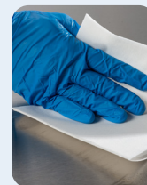
Salviette senza pelucchi