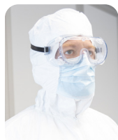
Occhiali protettivi a prova di schizzi

Indossare i dispositivi di protezione personale (DPI) consigliati.